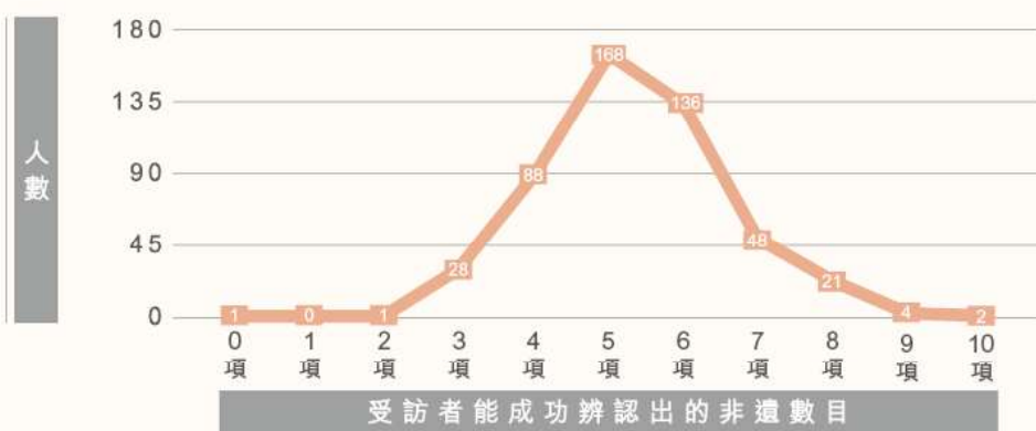
表 2：辨認非遺項目情況