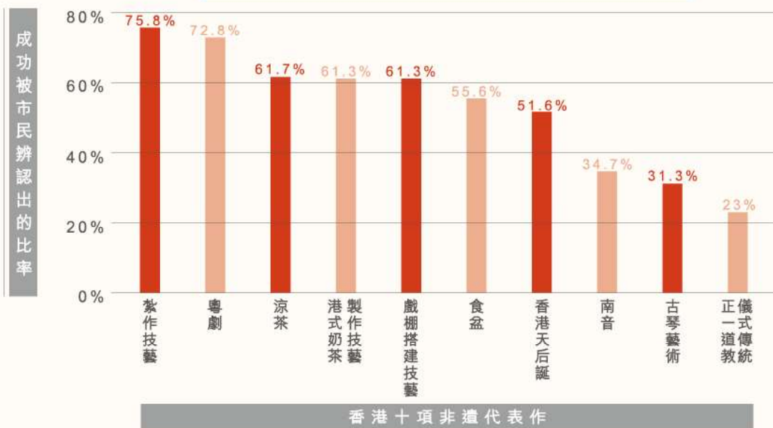
表 1：成功辨認「非遺代表作」比率